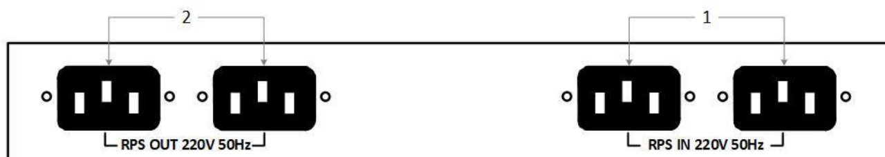
Рисунок 2. Задняя панель устройства однонаправленной передачи данных АПК InfoDiode SMART

На Рисунок 2 изображена задняя панель устройства однонаправленной передачи данных АПК InfoDiode SMART: